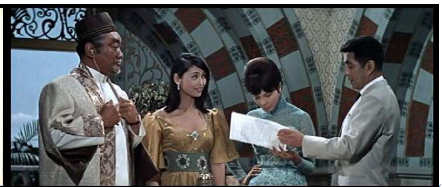
What's up Tiger Lily' (1966), una película de Woody Allen realizada íntegramente con imágenes de 'Kagi no Kag' una película japonesa de espías.