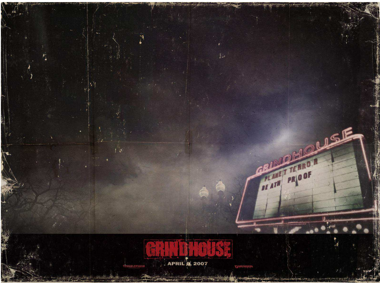
'Grindhouse' (2006), una película de Quentin Tarantino y Robert que homenajea al celuloide y a las antiguas salas de cine comercial.